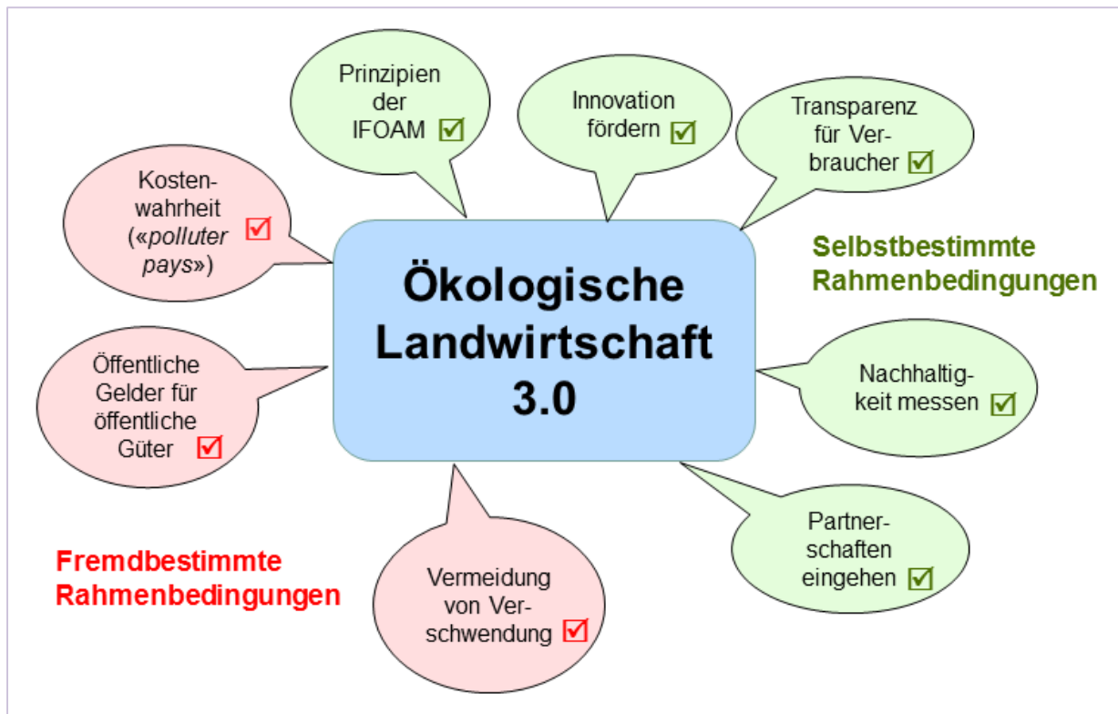
Abbildung 4: Rahmenbedingungen für die Weiterentwicklung des Biolandbaus von 2.0 zu 3.0.

Die Weiterentwicklung des Konzeptes Bio 3.0 und seine Umsetzung ist an verschiedene Rahmenbedingungen und Voraussetzungen gebunden, welche im Folgenden beschrieben werden. Die Rahmenbedingungen sind einerseits extern, d.h. fremdbestimmt – die Verbände des Ökolandbaus können sie nicht selbst regeln. Andererseits gibt es interne, d.h. selbstbeeinflusste Rahmenbedingungen, welche hauptsächlich durch die Arbeit und konzeptionelle Weiterentwicklung der Verbände des Ökolandbaus verändert werden können (siehe Abbildung 4).