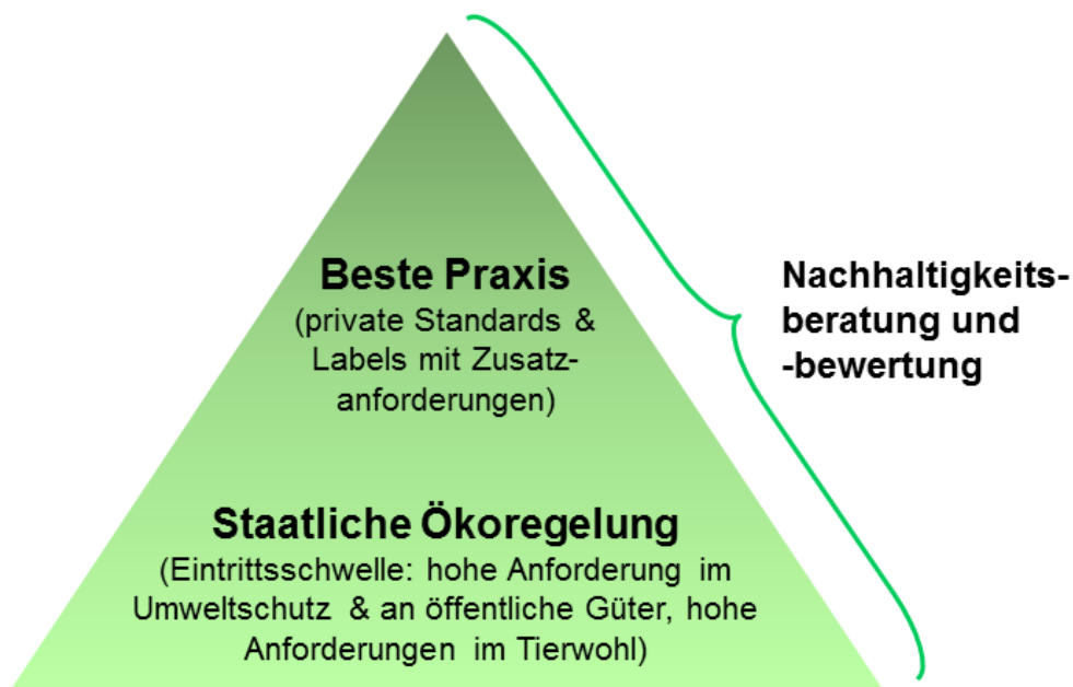
Abbildung 3: Bio 3.0 als dynamisches Entwicklungskonzept in Richtung beste Praxis.